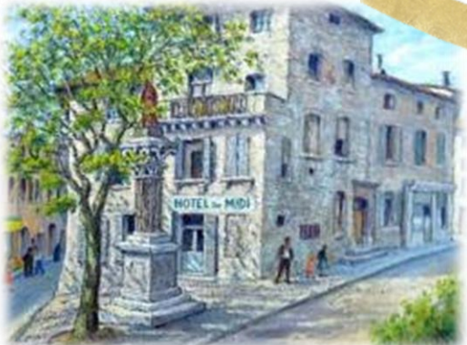
Hotel du Midi Alias « Le Magasin »

En sortant de l'hôtel de l'Atelier, je commence par chiner au Magasin . Des tonnes de meubles et objets à des prix défiant toute concurrence. Ce magasin s'est installé dans un ancien hôtel (l'hôtel du Midi), qui lui-même était dans une ancienne chapelle.